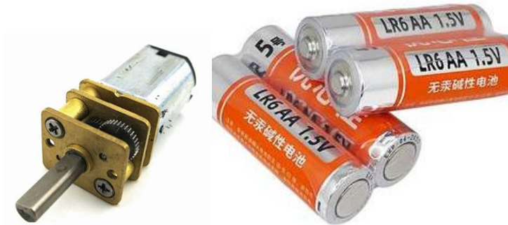
图3 电动机、电池外观（供参考）